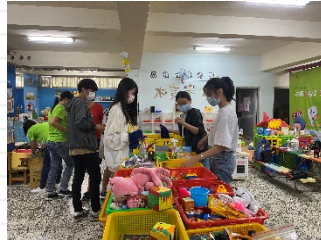
檢修二手玩具分享愛心