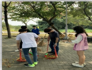
校園公共環境維護