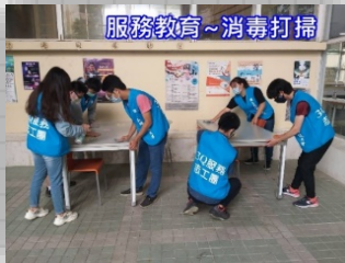
公用場所防疫消毒