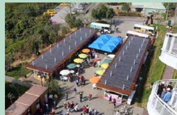
特色農產銷售中心