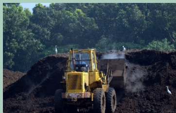
高科大友善耕作園區