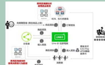
社群電商行銷中心