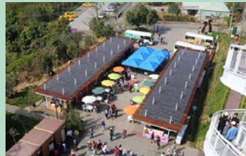
特色農產銷售中心